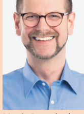
Martin Detterbeck Spielladen Detter- beck, Brunnen

Das Zahlenspiel Rum- my ist vielen bekannt. Nun gibt es eine trick- reichere Version. Nicht nur Zahlen di- rekt aneinanderrei- hen ist nötig. Es kön- nen auch einzelne Zahlen ausgelassen werden. Je mehr Blu- men auf den Steinen abgebildet sind, um- so mehr Punkte gibt